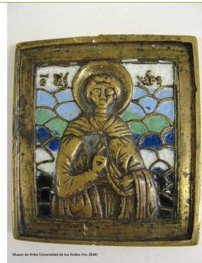
Museo de Artes Universidad de los Andes (Inv. IB48)

Título: Mártir Uaro Autor: Anónimo ruso Época: Siglos XIX - XX Técnicas y materiales: Placa de bronce fundido, moldeado y esmaltado (Inv. IB48)