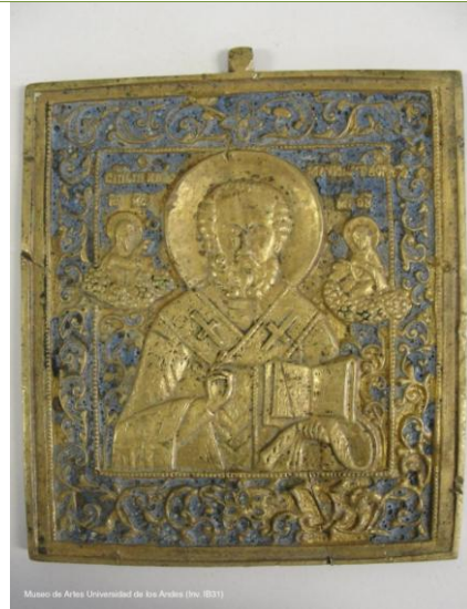
Museo de Artes Universidad de los Andes (Inv. IB31)

Título: San Nicolás Autor: Anónimo ruso Época: Siglo XX Técnicas y materiales: Placa de bronce fundido, moldeado, cincelado y esmaltado (Inv. IB31)