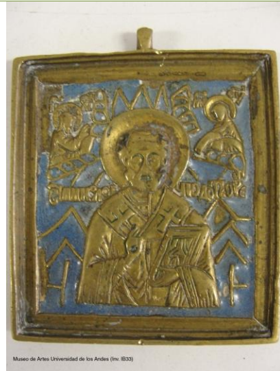
Museo de Artes Universidad de los Andes (Inv. IB33)

Título: San Nicolás Autor: Anónimo ruso Época: Siglo XIX Técnicas y materiales: Placa de bronce fundido, moldeado, cincelado y esmaltado (Inv. IB33)