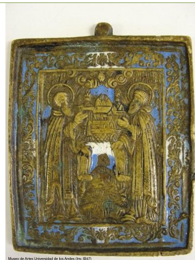
Museo de Artes Universidad de los Andes (Inv. IB47)

Título: Beatos Zocima y Beato Sabbatio de Solovki Autor: Anónimo ruso Época: Siglo XIX Técnicas y materiales: Placa colgante de bronce fundido, moldeado y esmaltado (Inv. IB47)