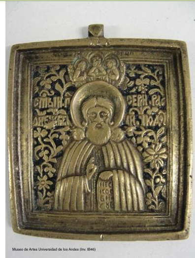
Museo de Artes Universidad de los Andes (Inv. IB46)

Título: San Sergio de Radonezh Autor: Anónimo ruso Época: Siglo XIX Técnicas y materiales: Placa colgante de bronce fundido, moldeado y esmaltado (Inv. IB46)