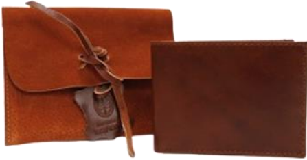
BILLETERA CUERO HOMBRE $ 20.900 Código: 10012234