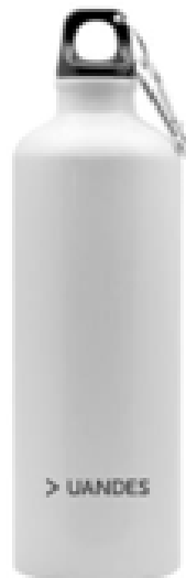
BOTELLA AGUA ALUMINIO