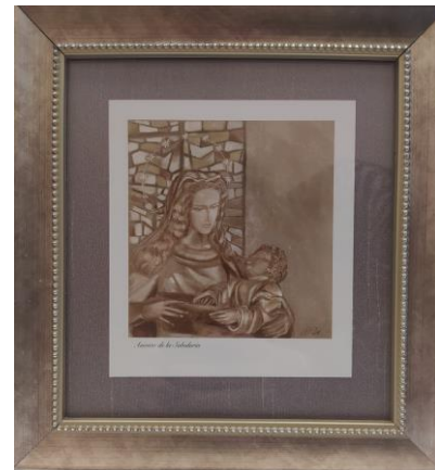
IMAGEN DE LA VIRGEN MARIA