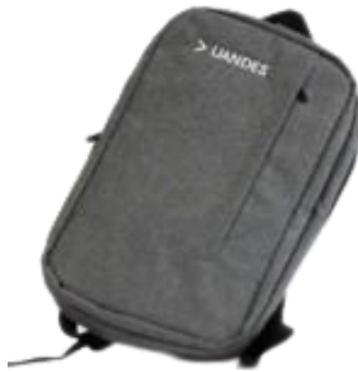
MOCHILA PC UANDES