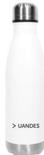
BOTELLA ALUMINIO BLANCO PREMIUM