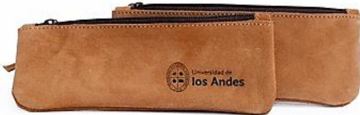
ESTUCHE C/LOGO $ 6.800 Código: 10012230