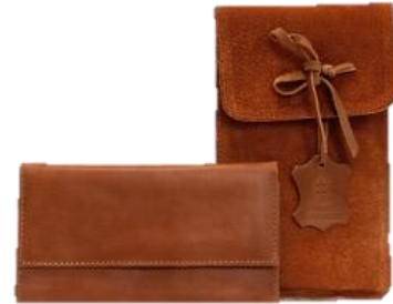
BILLETERA CUERO MUJER $ 22.000 Código: 10012231